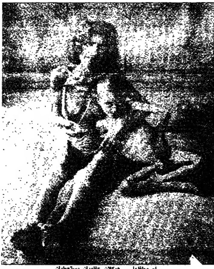
ام وظلها ... ميكان عظيمين يستحقين